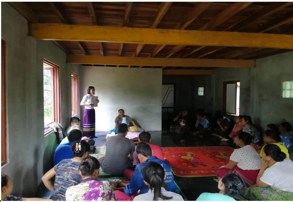
၈။ ကျေးရွာဖွံ့ဖြိုးရေးအစီအစဉ်ဆောင်ရွက်မှု မှတ်တမ်းဓာတ်ပုံ။